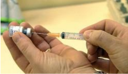
Il Cervarix viene inoccolato con una puntura

Non esistono dati di efficacia e di innocuità del vaccino. Nemmeno per le adolescenti. Ossia non esistono studi di lungo termine condotti su queste qualità – che dovrebbero essere certe sin dall'immissione sul mercato di un farmaco. Recita infatti il Bollettino Epidemiologico Nazionale dell'Istituto Superiore di Sanità (vol. 20, n. 1, gennaio 2007): «[...] nei bambini e adolescenti di età compresa tra 9 e 15 anni, in cui non è possibile eseguire studi di efficacia, sono state condotte delle valutazioni della risposta immune indotta dalla vaccinazione». Non esistono dunque studi sull'efficacia neanche per quelle 280.000 preadolescenti che saranno vaccinate per prime.